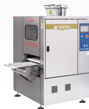
DINAMICA/ATHENA PLUS Spezzatrice arrotondatrice