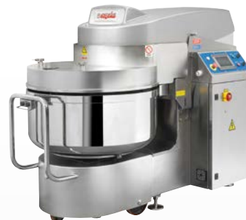
EVO Impastatrice a spirale a vasca estraibile