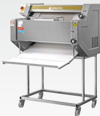
FB/2 Filonatrice per baguette