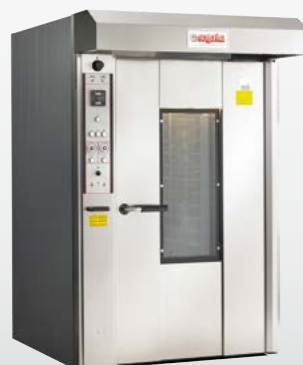
QUASAR TOP Forno rotativo