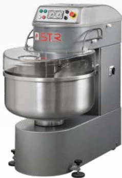
SPRINT V2 Impastatrice a spirale