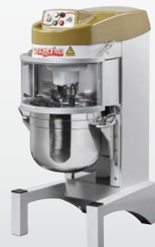
QUICK Mescolatore planetario