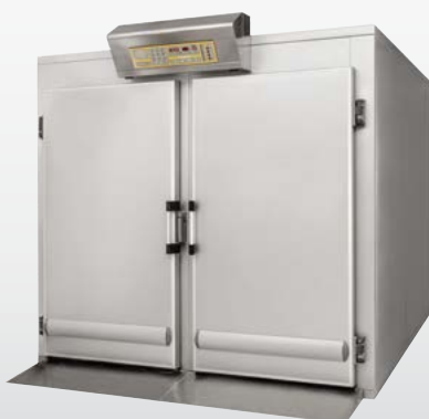
CLQ DELUXE Cella di lievitazione