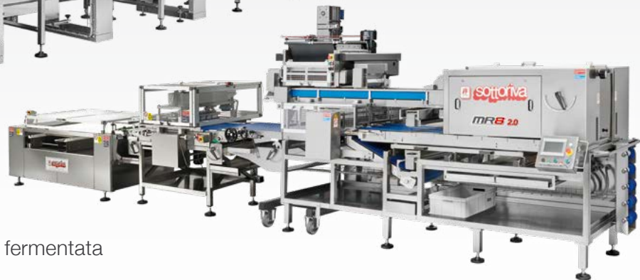
LINEA MR8 Spezzatrice zero stress per pane ciabatta e pasta fermentata