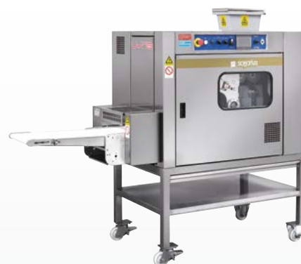
LYRA Spezzatrice arrotondatrice