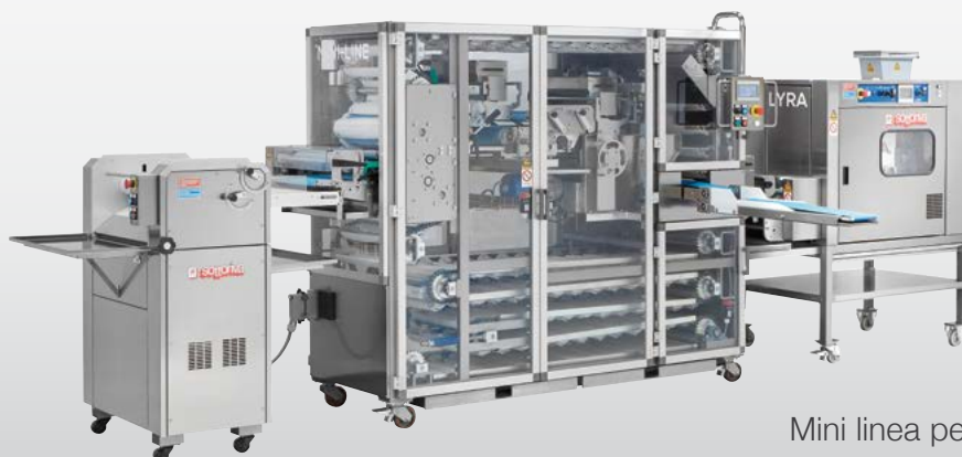
SMALL LINE Mini linea per filoncini e hamburger