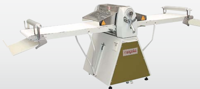
SPT3 Sfogliatrice manuale