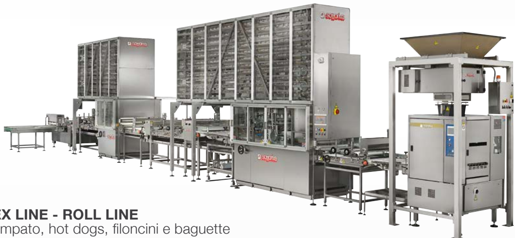
SUPER FLEX LINE - ROLL LINE per pane stampato, hot dogs, filoncini e baguette