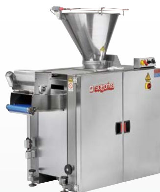
ZERO 5/ZERO 6/ZERO 10 Spezzatrice volumetrica