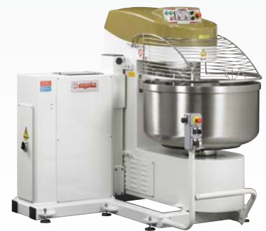
PRISMA Impastatrice autoribaltante