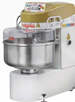
TWIST Impastatrice a spirale