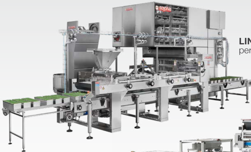
LINEA AUTOMATICA PANE GROSSO per filoni, pane in cassetta, baguette