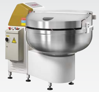
ARCA Impastatrice a forcella