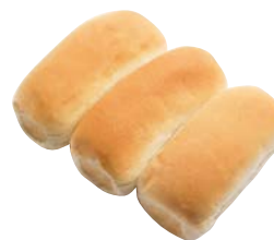
Pane al latte