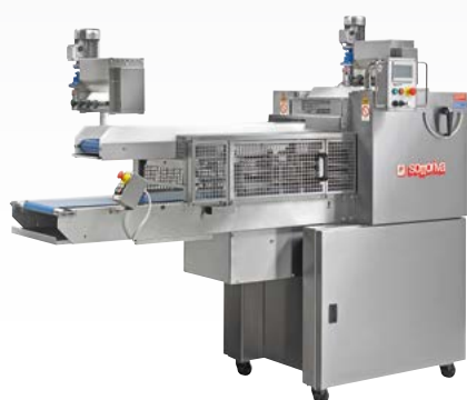
OPERA/OPERA-ONE Spezzatrice elettronica