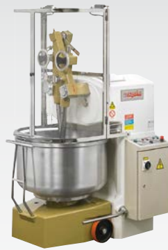
IBT Impastatrice a bracci tuffanti