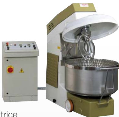
DUAL Impastatrice a doppio utensile