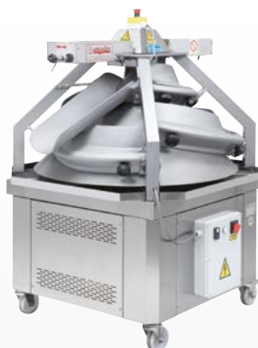
ASR/ASR 10 Arrotondatrice a cono