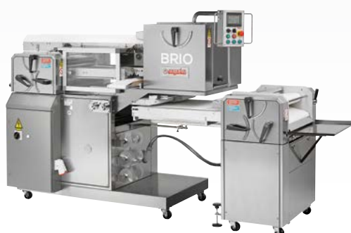
WINNER/DUETTO/BRIO Gruppo automatico