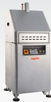
SP AR V3 Spezzatrice arrotondatrice