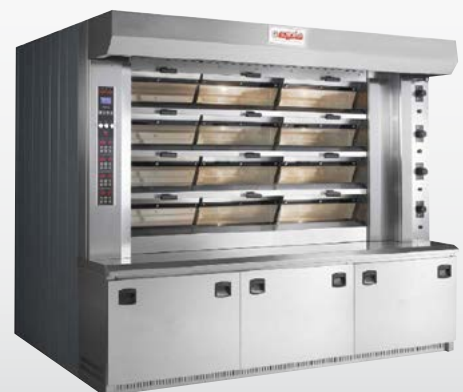
ANTARES Forno a piani a tubi di vapore