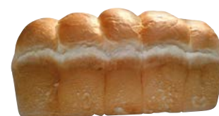
Pane da toast